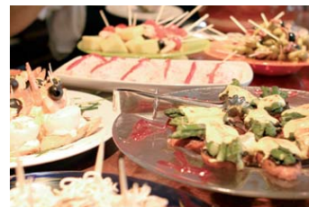
Una degustación de sabrosos pintos.

Los Salones Ibaizabal y Cadagua están diseñados para combinar sus reuniones o celebraciones con exquisitas cenas, comidas y cocktails. Capacidad de hasta 200 personas.