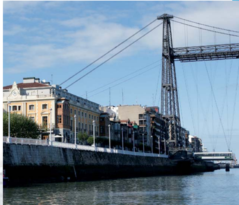
El Gran Hotel Puente Colgante con vistas a la ría.

El hotel ha sido galardonado con la “Q” de calidad como reconocimiento a sus consolidados estándares de calidad.