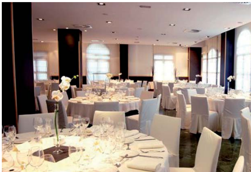
Salones con un diseño moderno y minimalista.